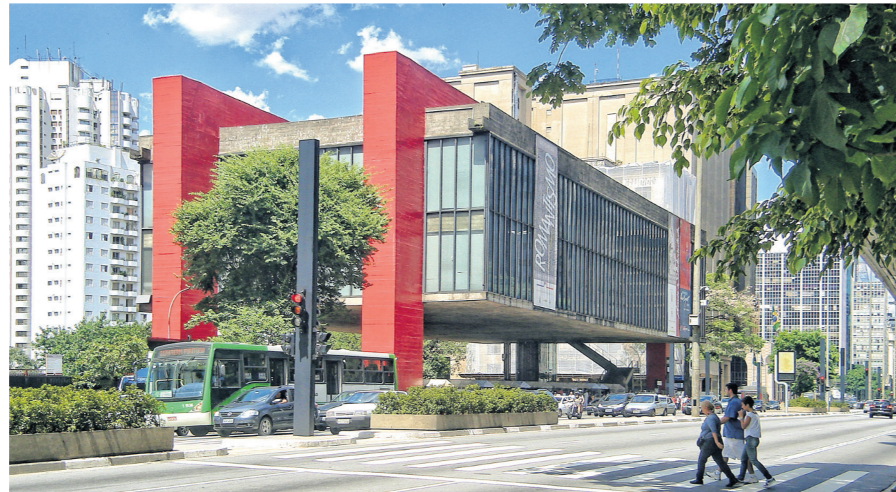
Le nouveau Musée d'art de São Paulo, achevé en 1968, dirigé par le mari de Lina Bo Bardi. Les piliers rouges très visibles supportent les structures d'exposition.

Un changement majeur pour l'architecte de 32 ans. «Pour Lina Bo Bardi, ce déplacement signifiait non seulement une rupture géographique