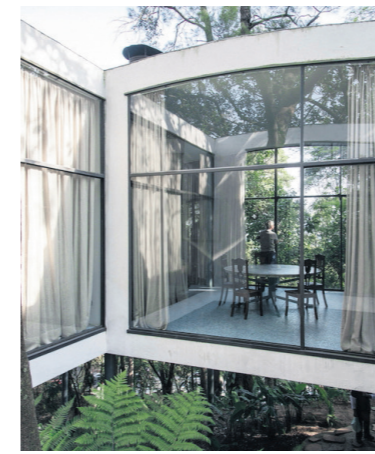
La Maison de verre, à São Paulo, bâtie en 1951, résidence de l'architecte.

Lina Bo Bardi renoue rapidement avec ses activités éditoriales consacrées à l'architecture qu'elle avait me-