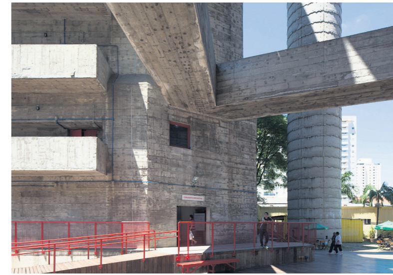
La SESC Pompéia, centre sportif achevé en 1971 à São Paulo, en prenant comme base une usine désaffectée. La réalisation est emblématique du courant brutaliste.