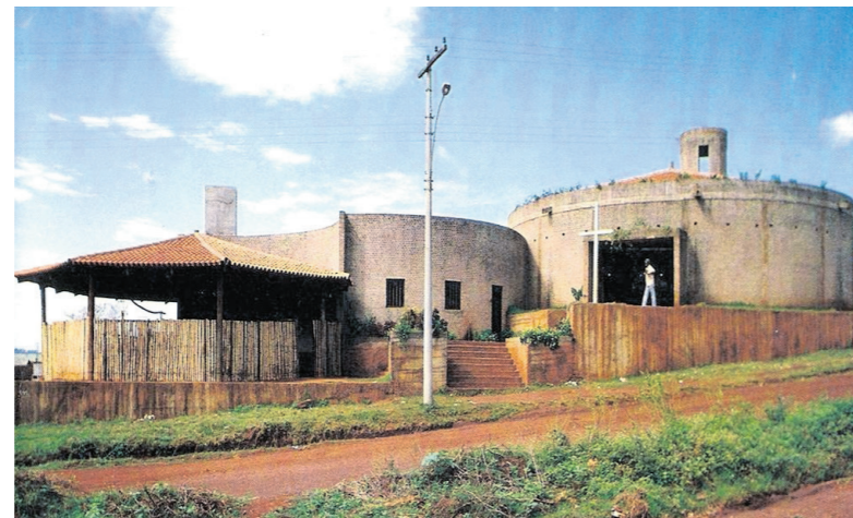
L'église Espírito Santo do Cerrado, à Uberlândia, dans l'État du Minas Gerais, achevée en 1976.

avec l'ancien monde et les séquelles de la guerre, mais surtout une recherche hors des limites occidentales civilisées, en parfaite correspondance avec les expériences de la première avant-garde européenne et latino-américaine, précise Olivia de Oliveira. Elle voit le Brésil comme «un pays inimaginable, où tout est possible», un lieu d'expérimentation et de maturation des réflexions lancées en Italie et impossibles à poursuivre dans l'Europe d'après-guerre.»